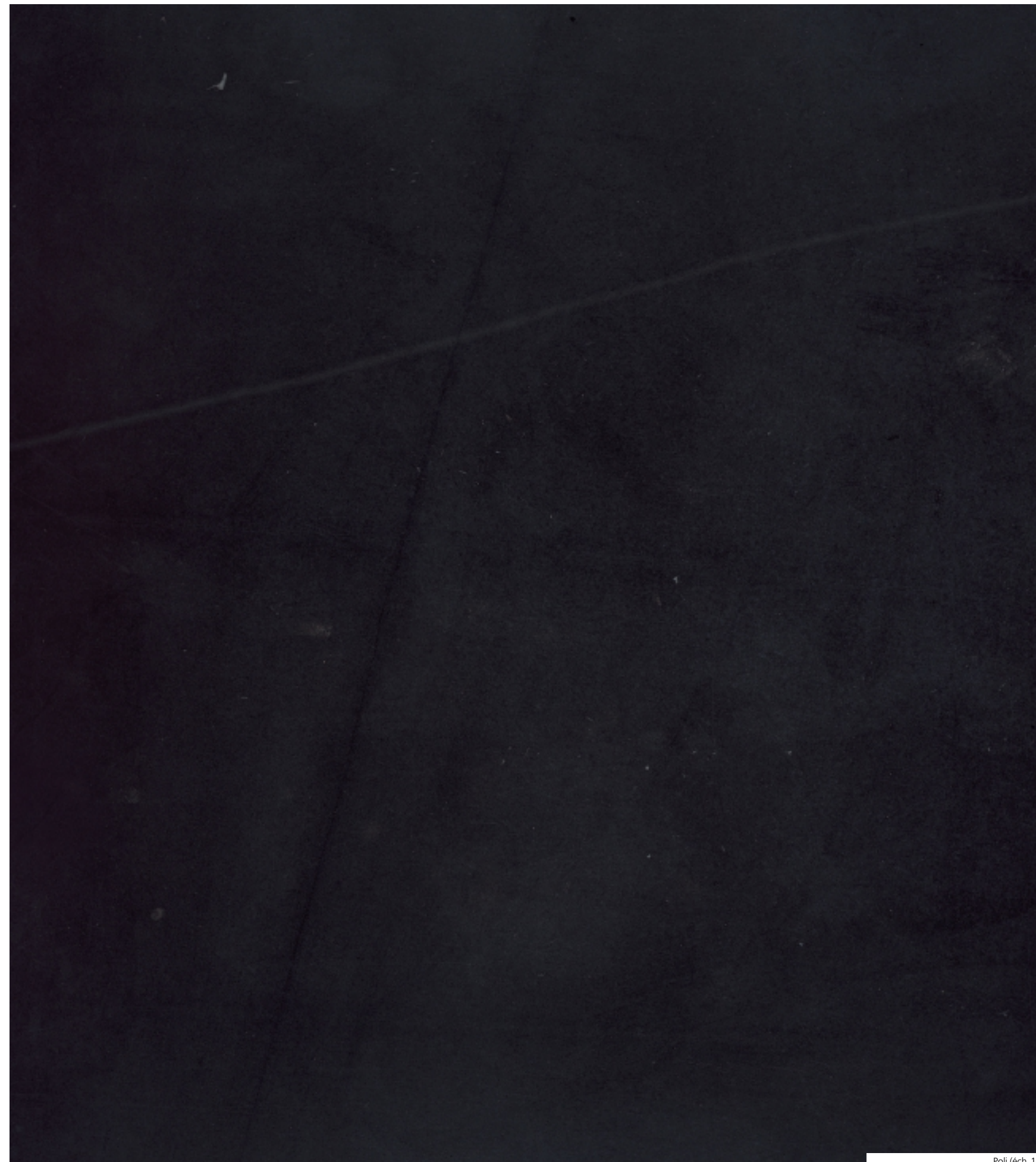
Poli (éch. 1:1)

Il est particulièrement apprécié pour le dallage et la décoration intérieure, ainsi que pour la sculpture fine.