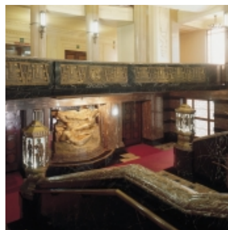
Charleroi - Hôtel de ville, arch. J. César - J. Andler - 1936

Cette pierre est rarement soumise à la taille, car c'est la finition marbrière qui met en valeur la profondeur de sa couleur noire. L'usage du poli en extérieur n'est pas recommandé.